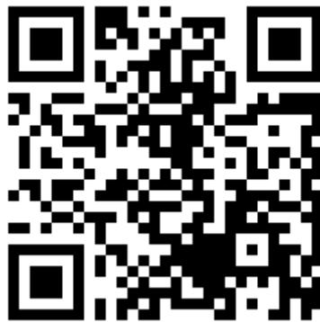
Table 1 网上报名端口二维码